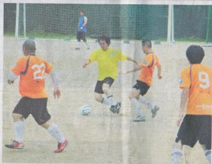
ドリブルで仕掛ける選手(新宮&和歌山県連-静岡)

来賓の田岡実千年新宮市長は「八咫鳥(やたがらす)が日本サッカー協会のシンボルマークであることから、ここ数年、サッカー協会の方が熊野の地を訪れています。八